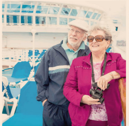
Demografia. Il trend legato all'invecchiamento resta tra i più gettonati

Tra gli ambiti prioritari, quello più promettente è la digital health. I consumi sono, invece, i più imprevedibili, dipendono dall'andamento delle cure prodotte e servizi innovativi e apprezzati dai consumatori, in funzione della fascia di età. Aggiunge-